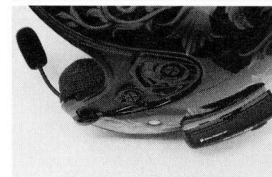
SHOEI・J-FORCEⅢに両面テープタイプの取り付けステーを使って装着したところ。このヘルメットは耳部分の形状が優れているため、φ32mmスピーカーをきれいに収納できる。