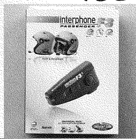
ヘルメット用ワイヤレスヘッドセット